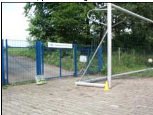
Wer hat den festesten Schuss? Die Messanlage war einer der Highlights.