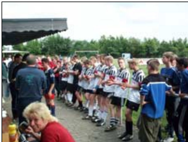
Beim Jugendturnier war auch dieses Jahr wieder einiges los.

Einziger Wermutstropfen einer ansonsten hervorragend durchgeführten Veranstaltung war die kurzfristige Absage bzw. das Nichterscheinen der Mannschaften des SV Oberschledorn und der SG Grafenschaft. (RK)