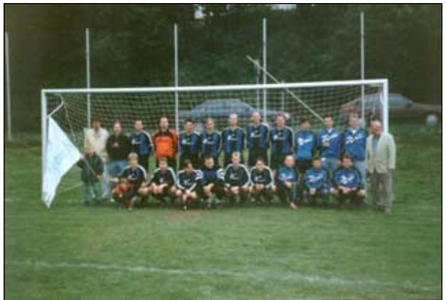
Der Aufstieg von 1999 ist abgehakt: Neuer Anlauf in der Kreisliga A Brilon heißt es für den TUS.

Die Entscheidungen in der Bezirksliga sind gefallen. Die wichtigste aus Medebacher Sicht: Nach zweijähriger Zugehörigkeit zur Bundesliga des Sauerlandes muß der TUS Medebach die Bezirksliga nach einer enttäuschenden Saison wieder verlassen und in der Kreisliga A einen neuen Anlauf nehmen. Die Ursachenforschung gestaltet sich nicht ganz so einfach. Ausschlaggebend war aber sicherlich, daß die zahlreichen Abgänge vor und während der Saison nicht kompensiert werden konnten. Immerhin: Zum Schluß gelang noch einmal eine kleine Trendwende, als aus den letzten sechs Begegnungen sechs Punkte geholt werden konnten. Das stimmt zuversichtlich für die nächste Saison in der Kreisliga A.